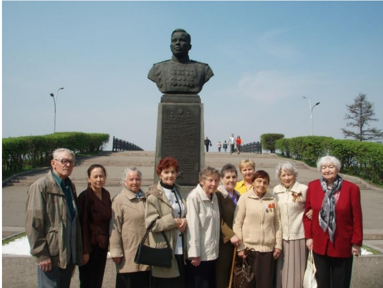
Встреча с ветеранами «Иркутскэнергосбыта»

компания в новом качестве начала осуществлять свою деятельность, как самостоятельная энергосбытовая структура, образовывались новые отделения по всей области, что усложняло взаимодействие с сотрудниками. Для повышения