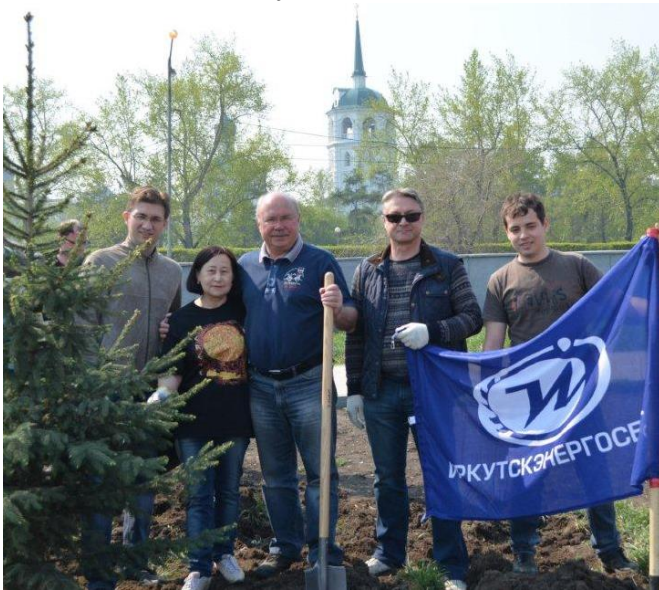
Посадка аллеи в честь 60-летия «Энергосбыта»

компания в новом качестве начала осуществлять свою деятельность, как самостоятельная энергосбытовая структура, образовывались новые отделения по всей области, что усложняло взаимодействие с сотрудниками. Для повышения